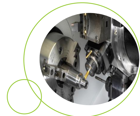
... à venir, tour multiaxe