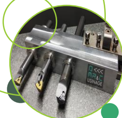
Assemblage, montage <<<