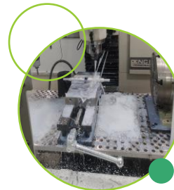
Fraisage 4 axes (18" X 9.5" X 16") <<<