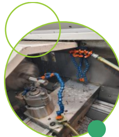
Tournage (Ø12" X 40") <<<